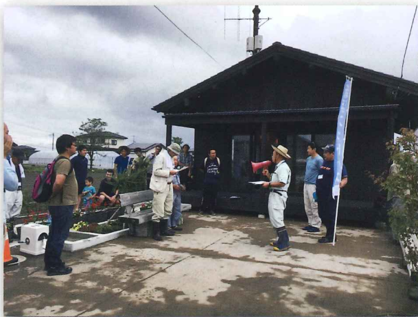
新浜みんなの家 (仙台市宮城野区岡田字浜通54の2)

※9時30分にバス停の前で新浜町内会の担当者が待機しています。 ※帰りの荒井駅行きバスの時刻 12:11、13:11、15:11発