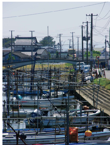
関上貞山堀 (平成 20 年頃)

せんだい 3.11 メモリアル交流館が 行っている震災以前の沿岸部を映し た写真を集めるプロジェクト「おら ほのアルバム」。ご提供いただいた 写真の中から、地域やテーマごとに 写真をピックアップし、みなさまと 一緒に写っている場所や行事、懐か しい思い出などをお話をする イベントです。